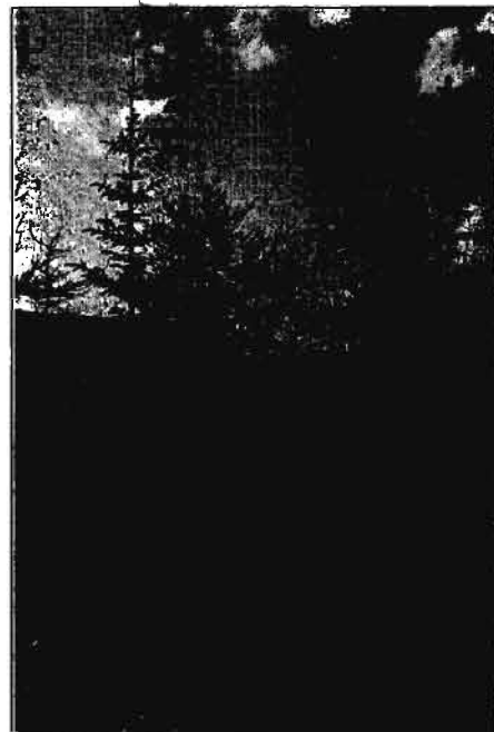
Sitkagreni á Stálpastöðum, sem vaxið er upp af græðlingum, en ekki fræi. Mynd: S.Bl. 1992.

Fyrstu nóttina sem ég var hér var farið að skyggja þegar ég kom upp eftir. Ég fór inn í húsið með minn