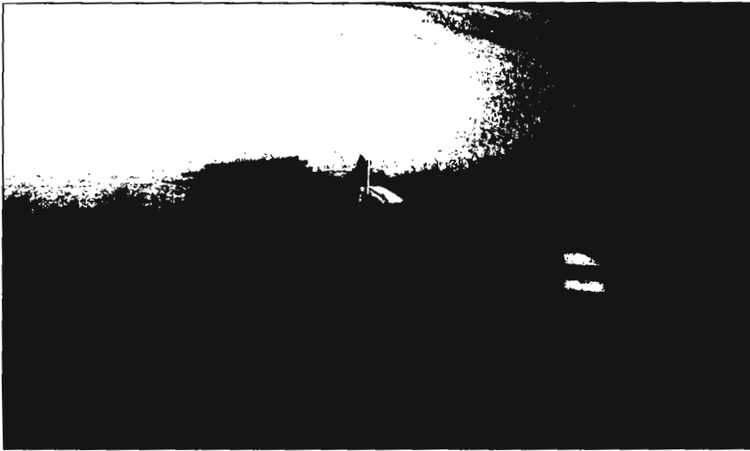
Bill hlaðinn trjábolum úr grisjuninni í sitkagreniteignum frá 1961.

Kaliforníu (US Forest Service), við stofnunina Forest Genetics Laboratory í Placerville, en það var ein elsta trjákyrbótastöð Bandaríkjanna. Þarna vann ég bæði í græðireit og svo var ég í hinum og þessum verkefnum. Sér í lagi var spennandi að vinna að víxlfrjóvgun og reyna að framkalla ný afbrigði. Þetta var allt