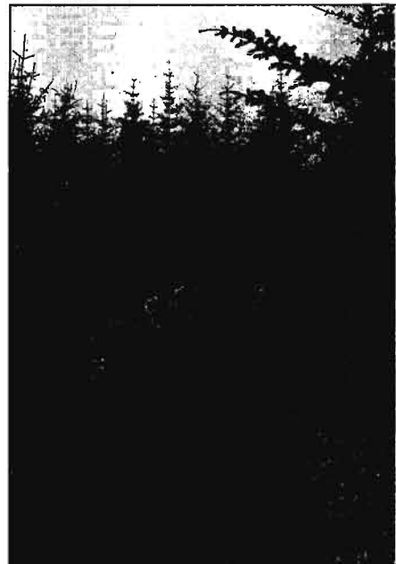
Norskir skógræktarstúdentar ganga gegnum sitkagreniskóg ofan til í Stálpastaðahlíðinni. Mynd: S.Bl. 1992.

Fyrst þegar Hákon fór með mér til að sýna mér Dalinn var margt öðruvísi en nú er. Uppbyggður vegur náði þá bara rétt inn fyrir hlið á Stálpastöðum og þar fyrir innan tóku við ógreiðfærir vegaslóðar. Stærstu barrplönturnar voru að komast í hnéhæð. Þarna kom sér vel minn ágæti Chevrolet en hann var lengi vel eina flutningatækið sem ég hafði. Ég hafði hvorki dráttarvél né hjólbörur. Þurfti ég því að nota Chevann til að flytja allt mögulegt, s.s. plöntur, girðingarefni, sement og steypumöl. Hvammur hafði staðið í eyði um tíma og húsið ólæst. Miðstöðin og klósettið voru frostsprungin, af því ekki hafði verið hirt um að tappa af eða frostverja. Þetta var ekki kræsilegt, þó að húsið væri að mörgu leyti skemmtilegt, en eldhúsaðstaðan var leiðinleg og erfið. Hún var í kjallaranum og hann var tæpast manngengur. Það þurfti að beygja sig og lúta höfði til að ganga þar um. Smá múrblanda og gólfúkur var yfir moldargólf, en þetta lak allt og flæddi í rigningum. Svo var mikill músagangur.