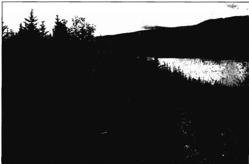
Úr Skorradal, í forgrunni land í skróða á Stálpastöðum. Í baksýn land í tötum í Haga. Mynd: S.Bl. 1992.

Þá langar mig t.d. að benda á íslenskt sitkagreni í Salnum í Kópavogi. Þar er það notað sem hljóðskermur. Það var BYKO sem styrkti grisjun á Stálpastöðum og í Haukadal í það verkefni. Eftir því