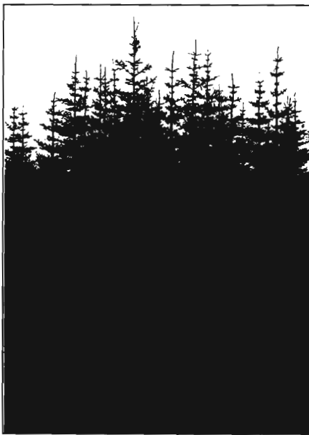
Stærsti sitkagreniteigurinn á Stálpastöðum var gróðursettur 1961. Kvæmið Cordova, Alaska. Tímni úr fyrstu grísjun í þessum teig var flett í þiljur Salanins í Kópavogi. Norsk kona, héraðsskógameistari í Bodö, virðir hann fyrir sér. Mynd: S.Bi. 1994.