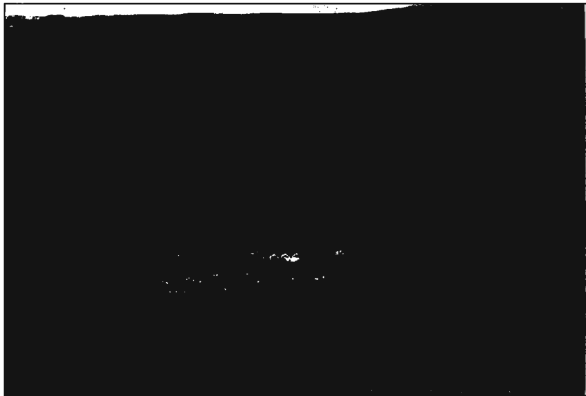
Horft að Hvammi í Skorradal yfir vatnið.

Nei, um það var nú ekki að ræða. Ég vann sumurin 1953 til 1955 fyrir Skógrækt ríkisins á Tumastöðum og svo einnig á Hallormsstað 1956 og fram á mitt sumar 1957. Ég var svo tíma og