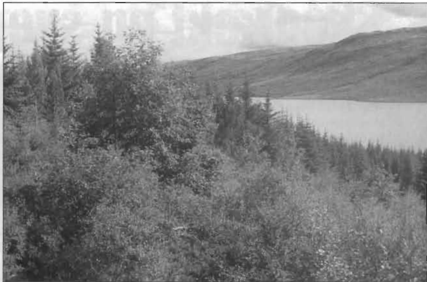
Úr Skorradal, í forgrunni land í skróða á Stálpastöðum. Í baksýn land í tötrum í Haga. Mynd: S.Bl. 1992.

Þá langar mig t.d. að benda á íslenskt sitkagreni í Salnum í Kópavogi. Þar er það notað sem hljóðskermur. Það var BYKO sem styrkti grisjun á Stálpastöðum og í Haukadal í það verkefni. Eftir því